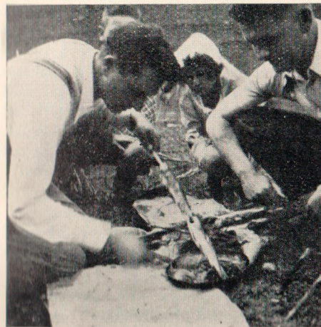
Pirospttyes pisztrángsütés nyáron