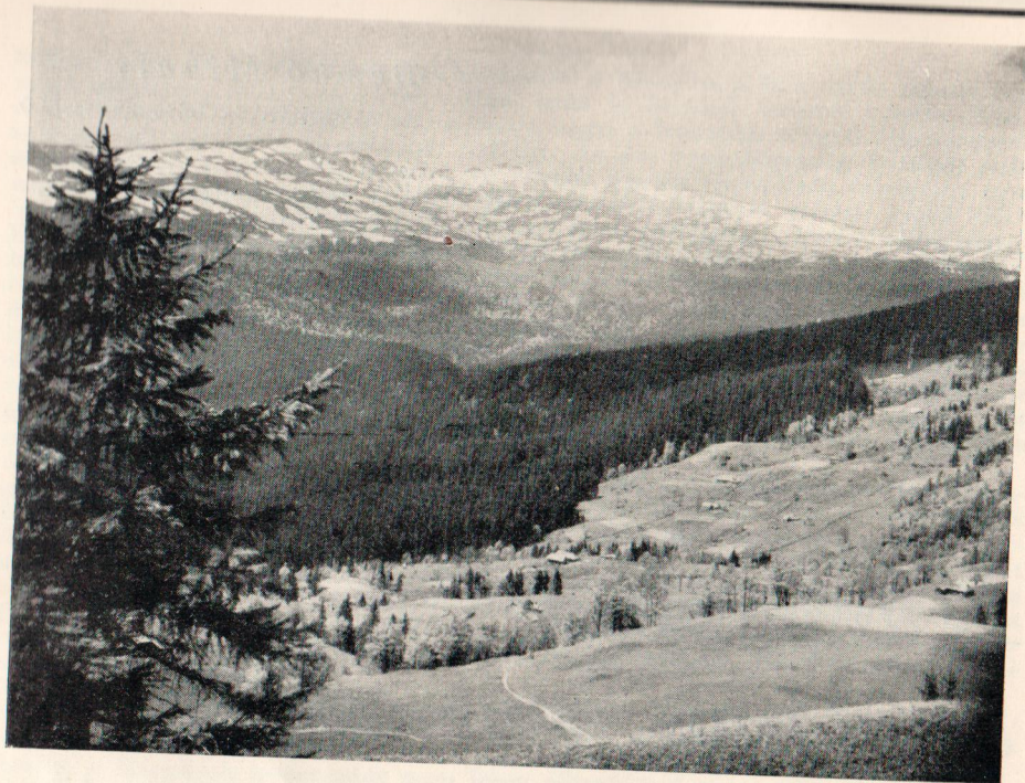
Bliznica (1883 m.)

A magyar társadalom, s a magyar tőke feladata most, hogy ezt a területet tényleg olyaná építse, amilyenné természetalkotta adottságai predesztinálják. A magyar szociális intézmények, bankok, gyermeknyaralások, üdülő és gyógytelepek, vendégipari vállalatok stb. száz és száz alkalmat találnak céljaik megvalósítására s tőkék nagyszerű gyümölcsötetésére. A prágai egyetem orvosprofesszorai kutatásaik folyamán megállapították, hogy gyógyhatás szempontjából jobbak a Semmeringnél s 30 kat. hold területet vettek meg gyógyszanatórium építésére. Jelenleg az a fontos, hogy a ruszin terület adottságait központilag irányított terv szerint kell kiépíteni s vezetni, hogy minden oda beépített szeg ne öletszerűen kerüljön helyére, hanem a nagy egységes tervnek megfelelően. Az érdeklődő közönség részére, amennyire ezen füzet terjedelmé megengedi, dióhéjban a következőkben ismertetem a terület viszonyait: