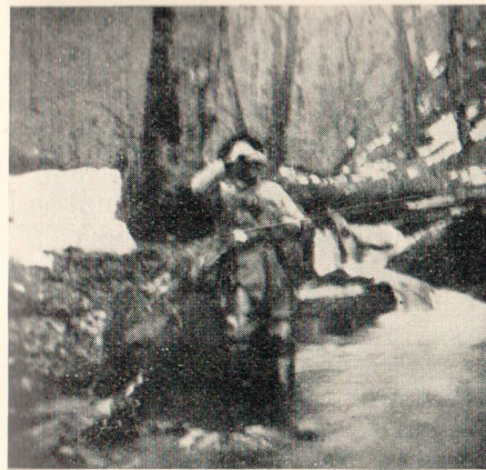
Pisztrángthalászat a Borzsava felső folyásánál